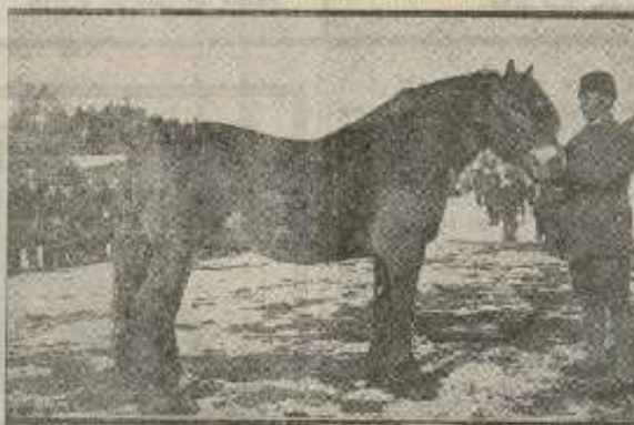
Den nye statshingst Naakve.

Hingsteutstillingen åpnedes i-gaar kl. 9 av statskonsulent Thorsgaard.